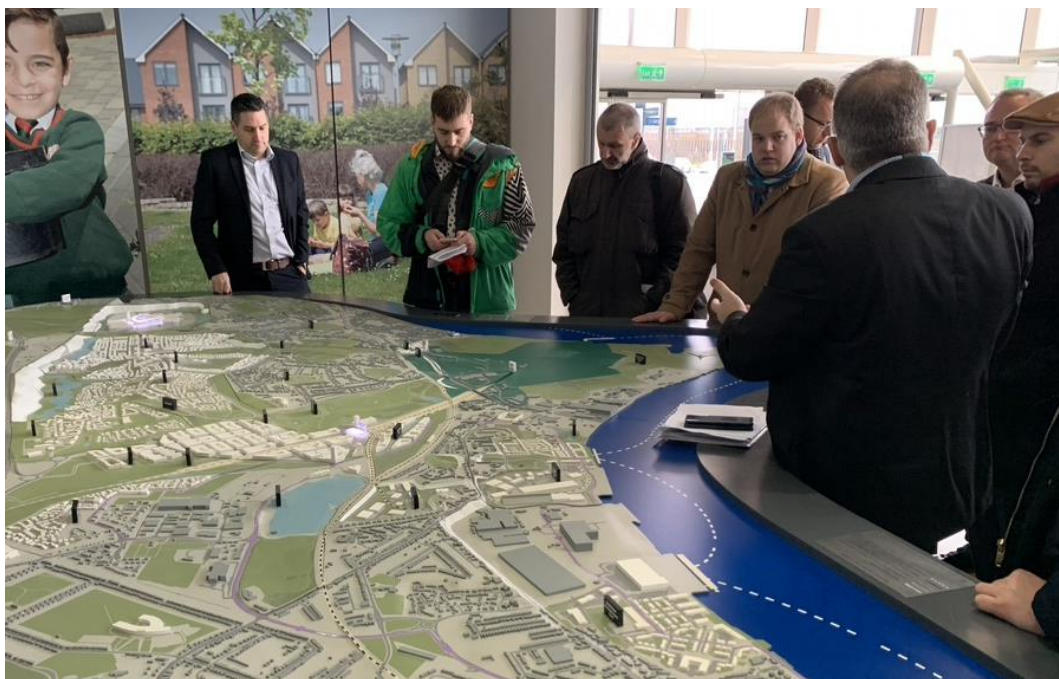
Obr. 3 Diskuse nad modelem rozvoje oblasti v okolí Ebbsfleet International

Dne 14. 1. 2020 se uskutečnila exkurze účastníků na realizovaný projekt High Speed 1 do železničních stanic v okolí Londýna. Exkurze byla zahájena ve stanicích St Pancras International Station a London Kings Cross, které jsou srdcem rozvoje přilehlé londýnské čtvrti. Stanice Stratford International a Ebbsfleet International, které katalyzují rozvoj celých příměstských oblastí Londýna.