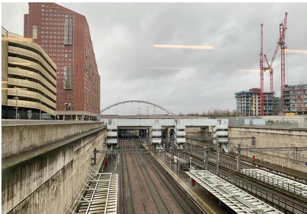
Obr. 2 Stanice Stratford International