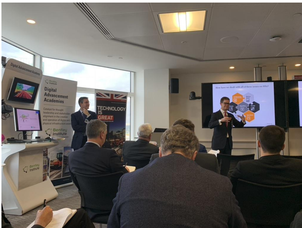
Obr. 1 Jednání workshopu ve školícím centru společnosti Bentley Systems Ltd.

Odbor mezinárodního obchodu Velké Británie uspořádal v Londýně ve dnech 13.–14. 1. 2020 workshop zaměřený na britské zkušenosti se zaváděním vysokorychlostní železniční dopravy, určený pro zástupce zemí Visegrádské skupiny (V4). Jednání se zúčastnilo množství hostů ze všech oblastí dotčených vysokorychlostní železniční dopravou – zástupci železničních společností a správců železniční infrastruktury, železničního průmyslu, projekčních a zhotovitelských společností, výzkumných institucí a univerzit.